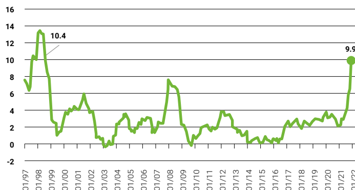
Obrázek: Graf růstu inflace