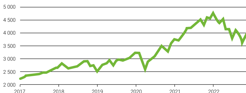
Vývoj hodnoty indexu S&P 500 (v USD)

Ceny akcií druhý měsíc v řadě rostly. A to nejen hodnota amerického indexu S&P 500, ale dařilo se i akciím v Evropě (hodnota indexu MSCI Europe). A ještě větší růst pak zaznamenaly akcie na rozvíjejících se tržích, kde hodnota indexu MSCI Emerging Markets v listopadu stoupla o více než 10 %. Hlavní zásluhu na tom má Čína. Dařilo se také dluhopisovým fondům a zazářily drahé kovy. Vývoj na tržích byl ovlivněn především mírným poklesem inflace v USA. V meziročním srovnání spotřebitelských cen je sice míra inflace stále hodně vysoká, ovšem dynamika inflace během podzimu slábne a tempo zdražování se zpomaluje. Další vývoj inflace je stále nejistý, a i nadále bude záviset